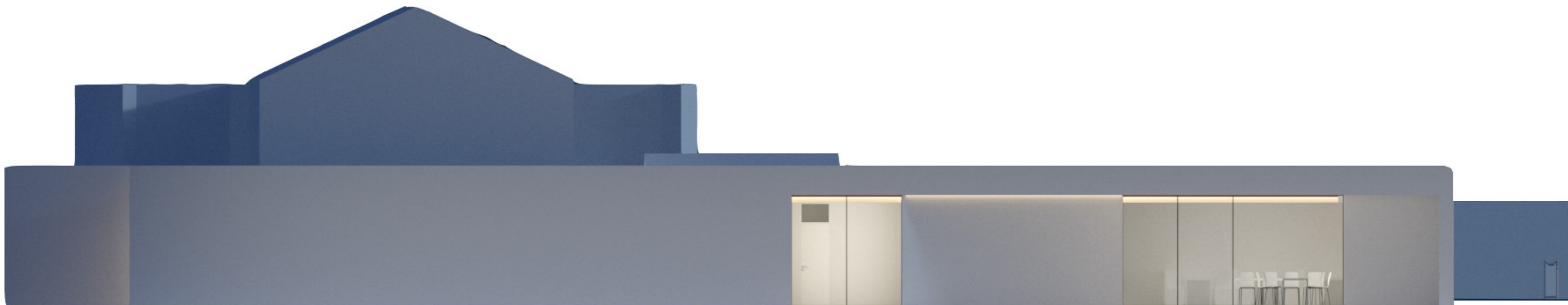
pohled východní - vstup